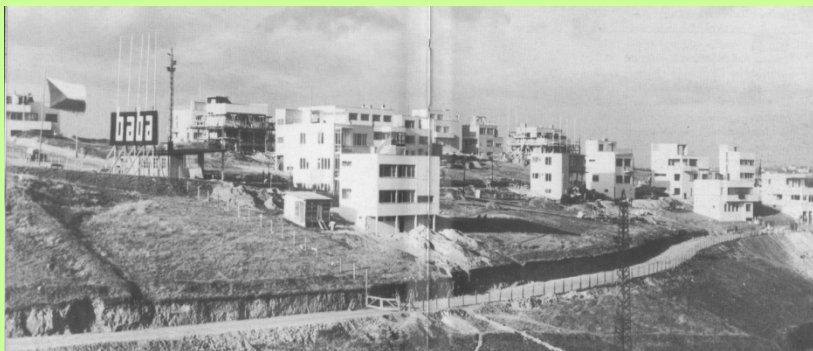
zdroj: Templ, S. (2000): Baba – osada svazu Čs. díla Praha